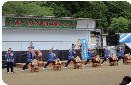
南アルプス白鳳太鼓演奏