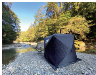
テントサウナの使用例

テントサウナとは、耐熱性テントの中で、本格的なロウリュ(蒸気)を体験できる移動式サウナのこと。キャンプ場や河原などに設置して、中で体を温めた後、外気浴で涼んだり、川の天然の水風呂にダイブしたりして楽しむ人が多いようです。自然豊かで川もある早川町には、ぴったりなのではと思っています。