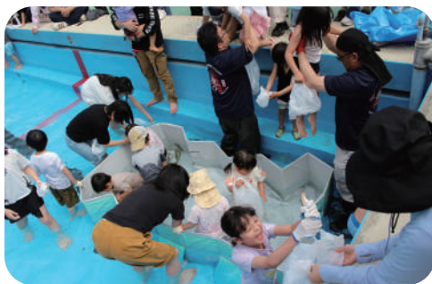
つかみ取り会場の様子