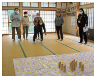
「モルック」を楽しむ様子

詳しい日程は、毎月「お知らせ版」に記載しているよ！申込は不要なので、気軽に立ち寄ってね！