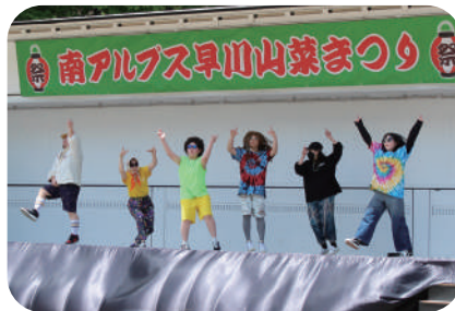
S.D.C.Hのダンスパフォーマンス