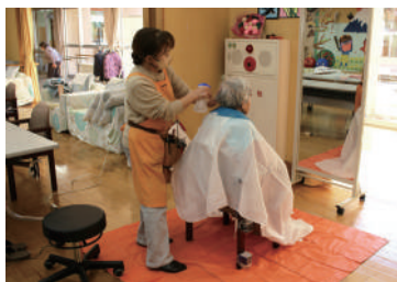
訪問理美容サービス