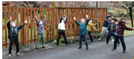
ラジオ体操をしている様子

ラジオ体操サークルでは、「生涯健康」を目標に、早川町の歌に合わせたリズム運動やラジオ体操、時には百歳体操を行っています。現在60～90代の草塩集落の方々を中心に行っていますが他区からの参加者もいます。誰でもできる優しい運動です。ぜひ気軽に参加してみてください。