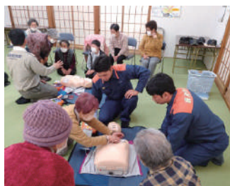
救急講習を開催した際の様子