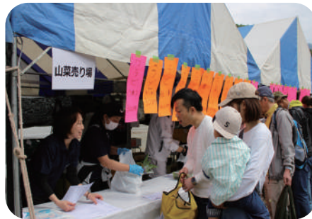
山菜の販売の様子