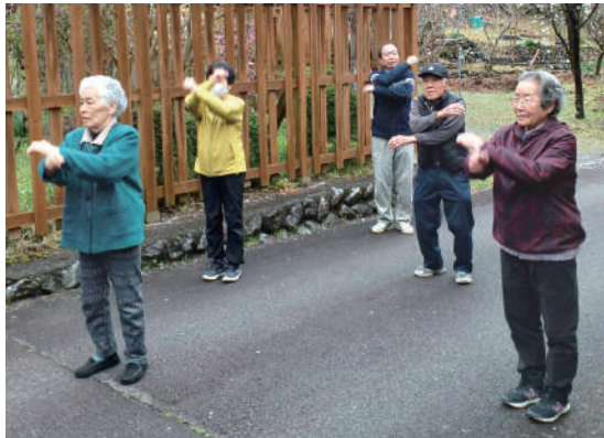
ラジオ体操をしている様子