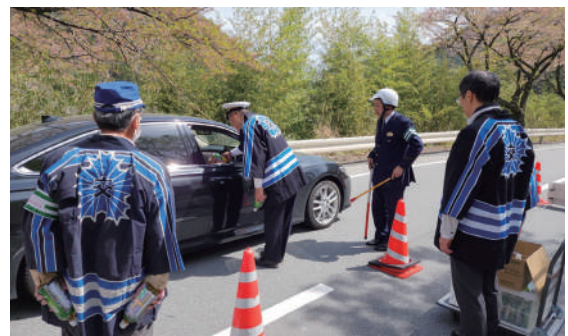
ドライバーへ街頭指導とお茶等を配布

令和8年春の全国交通安全運動期間中の4月9日(木)に、南アルプスプラザ前の県道にて南部交通安全協会、南部警察署、早川町による総合街頭指導が行われました。