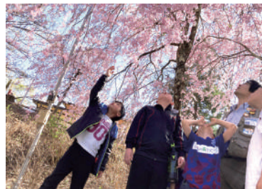
奈良田集落内の桜