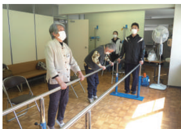
リハビリ教室の様子