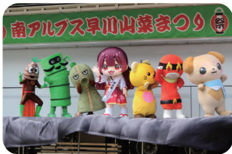
峡南5町ゆるキャラ紹介