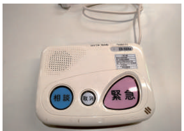
緊急通報システムの器具