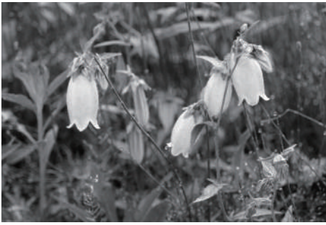
ホタルブクロの花です。

梅雨の時期に足元を見るとホタルブクロの花が咲いていることがあります。大きく可愛い花なので好きな方も多いかもかもしれません。この花はその特徴的な形から「釣鐘草」や「提燈花」などとも呼ばれます。普通、多くの花は上向きに咲いていることが多いですが、ホタルブクロは異名の通りぶら下がるように下向きに咲いています。これはなぜでしょう？決して花が大きくて重いからではありません。実は来て欲しい昆虫を限定する仕組みなの