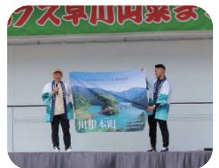
美しい村連合「川根本町」PR