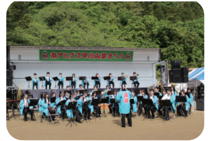
品川区青稜中学校 高等学校吹奏楽部演奏