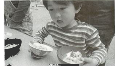
▲炊き込みご飯の完成!