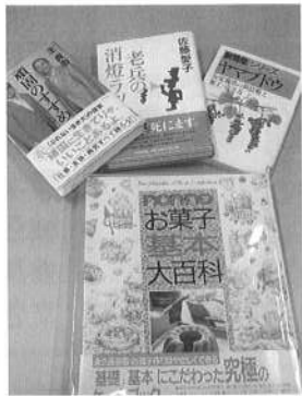
▲役場で買っていただいた本

早川町には、図書館がありません。でも、交流センターには、町民からお借りした本、いただいた本、そして、今回のように町からいただいた本等が8000冊近くあります。ぜひ、交流センターにある図書室にいらしてください。