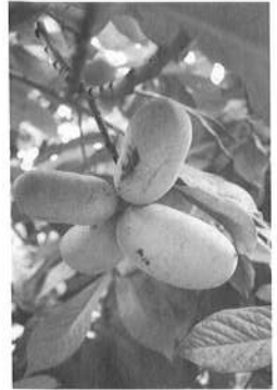
▲ポポのなっているところ

そこで、現在すでにポポを出荷していただいている方他に、ポポを育てている方を探しています。1kg300円で買い取らせていただきます。アイスの原材料なので、大きさや見栄えは関係ありません。ポポを育てている方はぜひ上流研までご連絡ください。また、管理されていないで放置