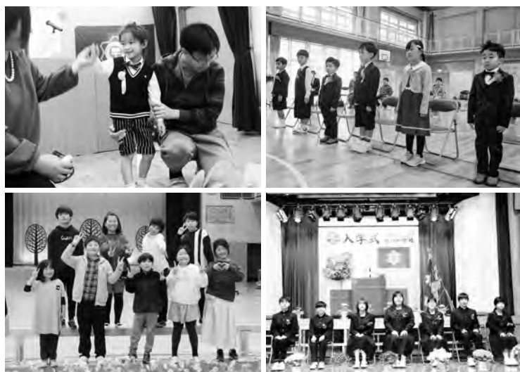
早川南保育所入園式(左上)、早川南小学校入学式(右上) 早川北小学校進級式(左下)、早川中学校入学式(右下)