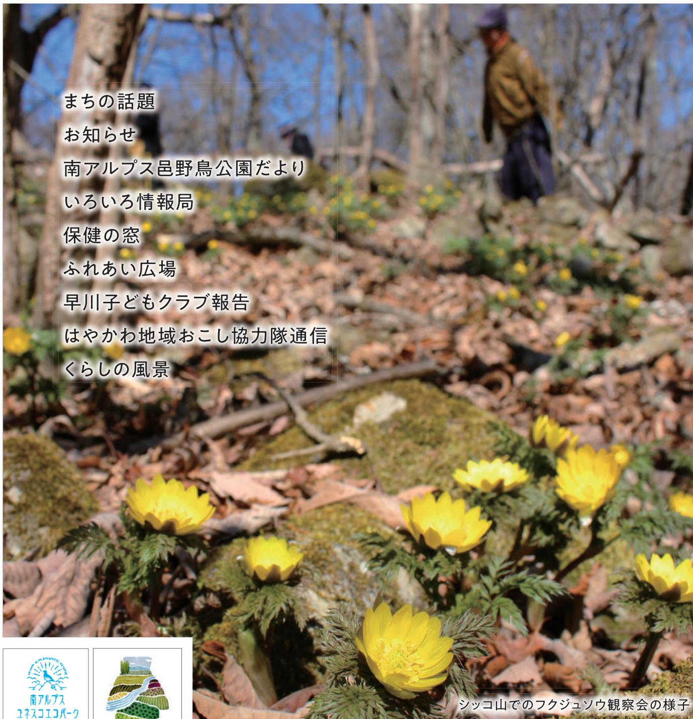
シッコ山でのフクジュソウ観察会の様子