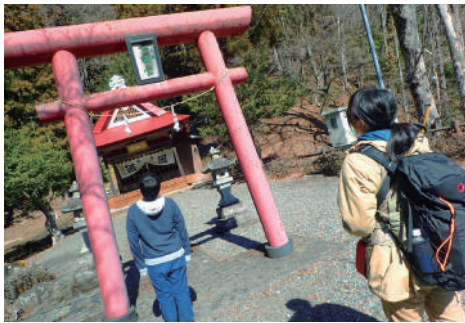
七面堂をお参りさせて頂く

「早川子どもクラブ」とは、毎月早川町の子供達が集まり町の魅力を発見しながら生きる力を身に付ける活動です。