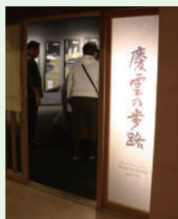
資料室 「慶雲の歩路(かちじ)」