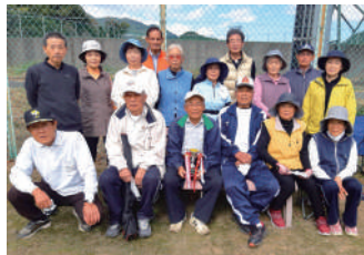
R4南巨摩郡グラウンドゴルフ大会優勝時

グラウンドゴルフのサークルでは、毎回試合形式で練習を行い、楽しみながら活動しています。コースを回りながら和気あいあいとおしゃべりもはずみ、自然と仲が深まります。現在、60~80代の方を中心に活動中。用具の貸し出しがあり、初めての方も安心です。体験参加も歓迎しています。