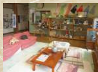
売店ではドリンクやアイス、動物グッズ等の販売あり