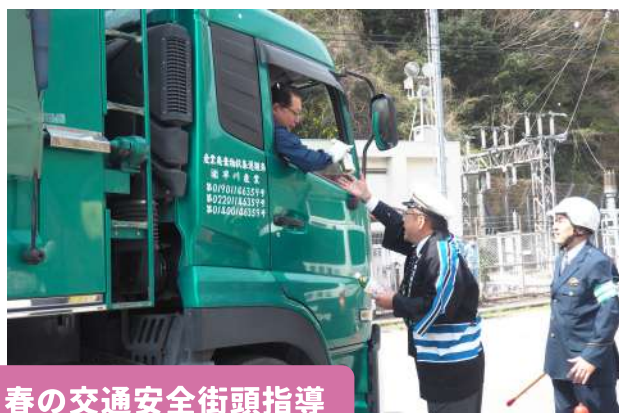
春の交通安全街頭指導

4月6日(日)にヘルシー美里で三里地区の桜まつりが開催され、カラオケ大会などを楽しみました。