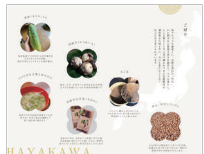
支援員が作成した伝統野菜のリーフレット裏面