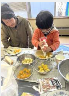
調理実習中の様子