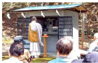
山住神社でのお祭りの様子 毎年4月17日には「五箇地区ふるさと祭 り」が開かれ、山住神社には地域の人々 が集まり、山の神様を祀ります。

山住神社は昭和 60 年に現在の 場所に移されていて、以前は 「栗山」と呼ばれる山の中に まっ 祀 られていたんだって。