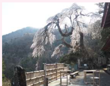
上:早川中学校前の県道 下:学定寺のイトザクラ