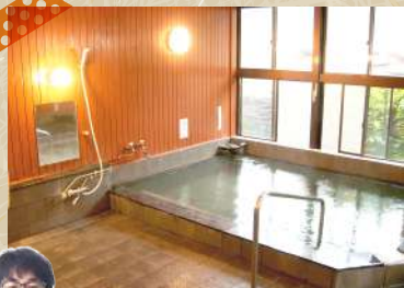
ヘルシー美里 光源の里温泉