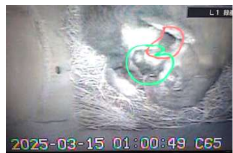
ムササビの双子の赤ちゃん(赤と緑で囲われたもの)

ムササビは夜行性のため日中は巣の中におり普通は観察することは出来ません。しかし、野鳥公園では巣箱の中にカメラを設置しているので、この親子の様子をいつでも観察することが出来ます。お母さんのお腹の上で休む様子やお乳を吸う様子など可愛い姿を見ることが出来ますよ！目が開いてからは巣の外をのぞく様子も見られると思います。早川町民の皆様は野鳥公園へは無料でご入園いただけますので、是非直接見に来てあげてください。今後の成長が楽しみです！