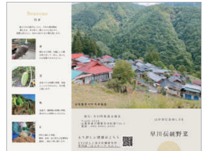
支援員が作成した伝統野菜のリーフレット表面

そんなわけで今年度も町内各地に畑をお借りしつつウロウロ作業や巡回に伺う予定です。ご要望・ご意見・最近の畑の状況などお気軽に声をかけていただけたら嬉しいです。