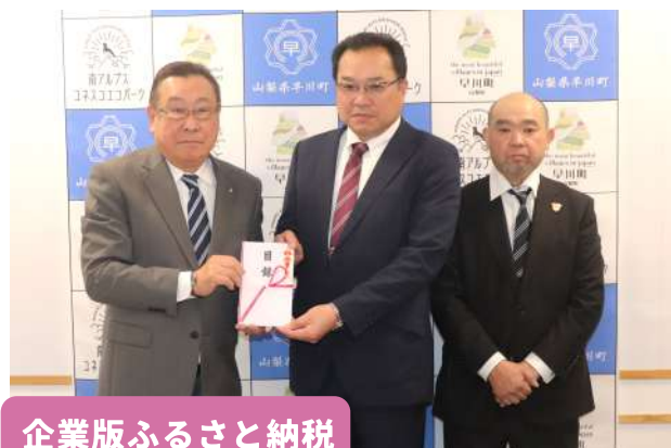
企業版ふるさと納税

4月10日(月)に南アルプスプラザ前の県道で南部交通安全協会、南部警察署、早川町による交通安全の街頭指導が行われました。