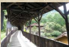
温泉への渡り廊下

宿泊施設「ヘルシー美里」では日帰り入浴も可能。温泉に含まれる塩分は、かつてこの地が海だった頃の海水が地中に閉じ込められた「化石海水」に由来していると言われています。この塩分のお陰で保温や保湿効果が期待できます。浴場では、この冷鉱泉かけ流しの「冷泉」と適度に加温した「あつ湯」の両方が楽しめます。