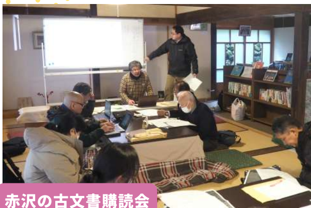
赤沢の古文書購読会

3月29日(土)に赤沢宿 宿の駅 清水屋で、安政地震後の交通復旧をめぐる古文書を読み解く会が開かれました。