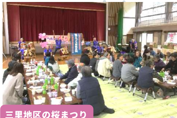
三里地区の桜まつり

3月29日(土)に赤沢宿 宿の駅 清水屋で、安政地震後の交通復旧をめぐる古文書を読み解く会が開かれました。